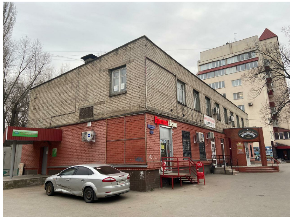
Вид 1 до реконструкции