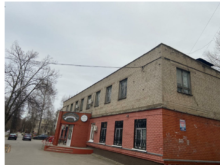
Вид 2 до реконструкции