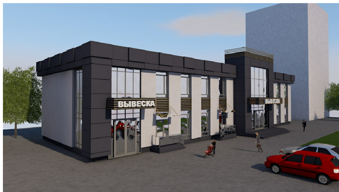
Вид 1 после реконструкции